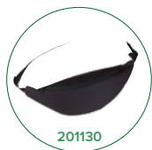
201130 Sacoche de transport