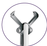
Dents de rat