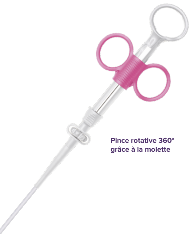
Pince rotative 360° grâce à la molette